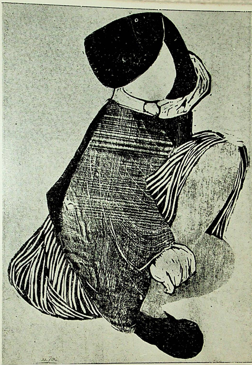
ANNA LUIZA BELLUCCI FIGURA III