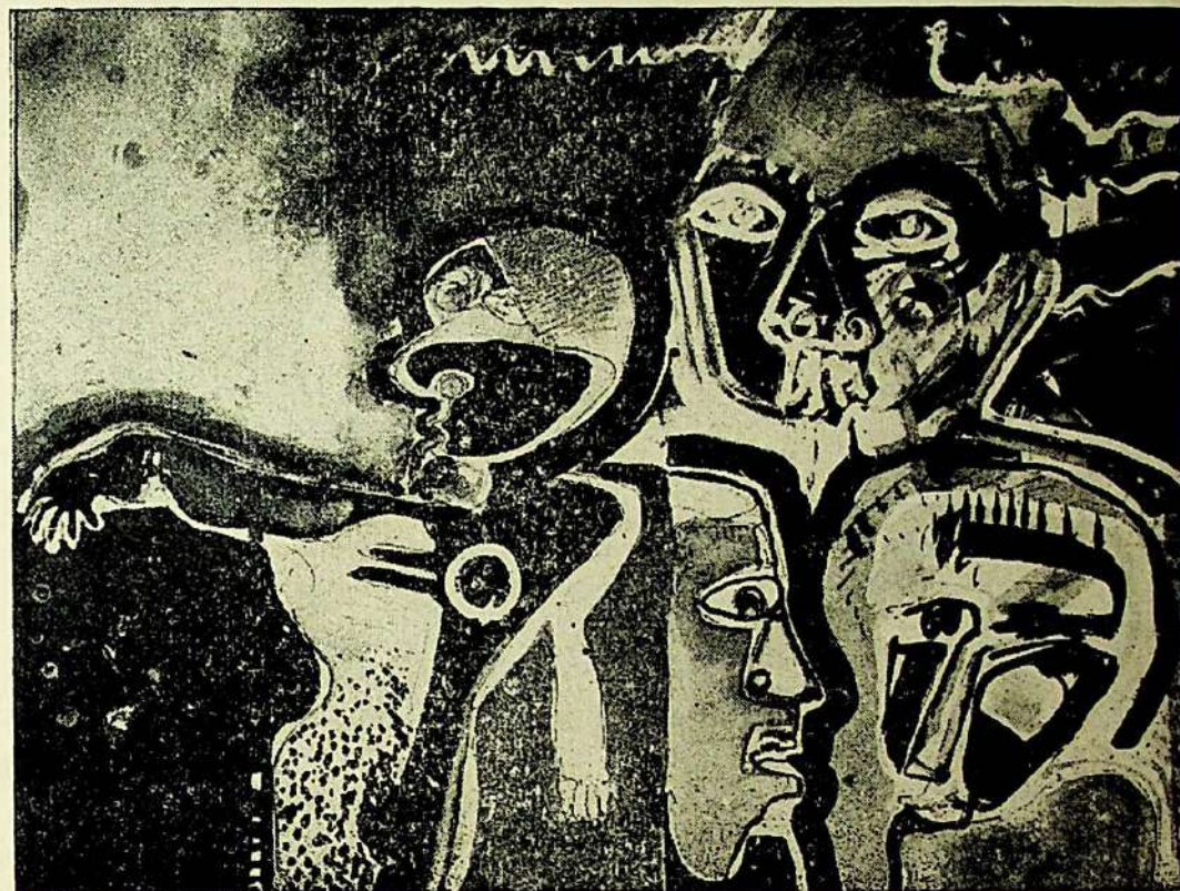
VERGARA, Carlos Augusto - Desenho I, 1965