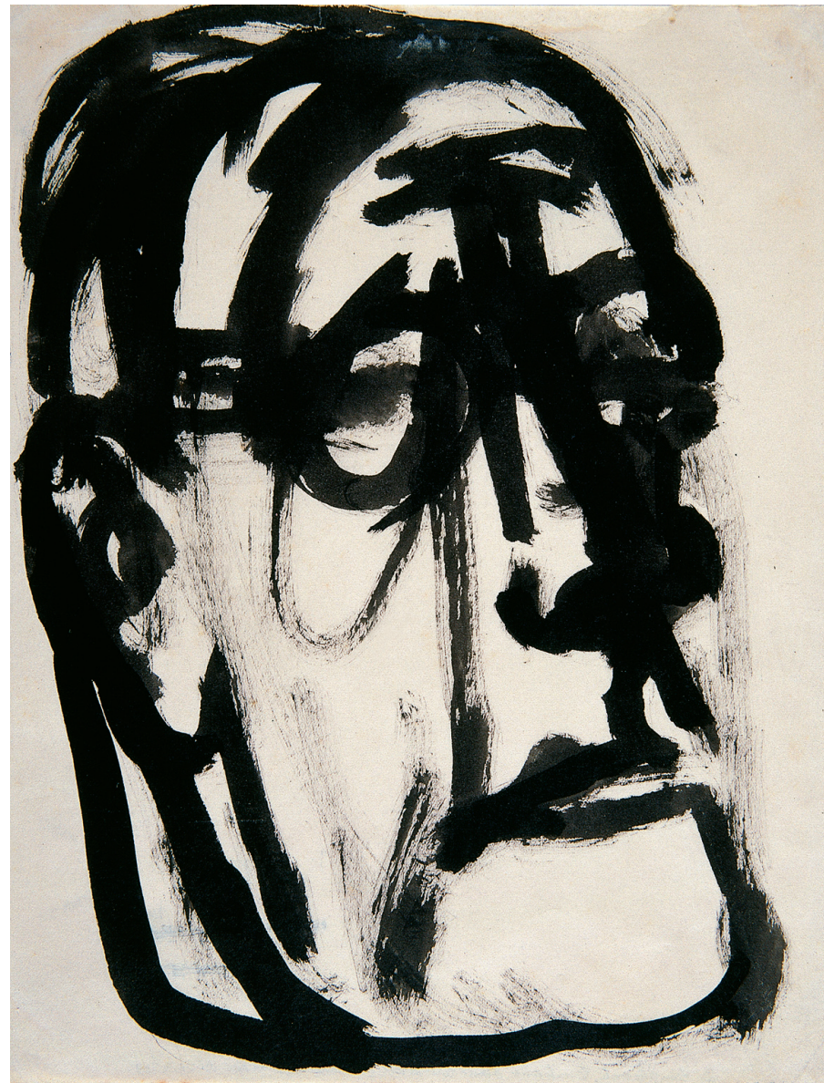
Mário de Andrade (Caricatura), 1933